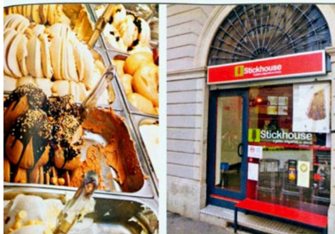
L'esterno, col logo aggiornato, del negozio Stickhouse in via Vigevano-via Corsico a Milano

marsi e arriva anche nel Principato di Monaco (20, rue Comte Felix Castaldi, www.bellamia-gelateria.it ) mentre in Svizzera, a Losanna, la novità è rappresentata da Gea-Gelateria Artigianale Italiana ( gea-gelateria-artigianale.ch ) con una proposta di gusti a chilometro zero, prodotti con frutta fresca coltivata da agricoltori regionali, e gelati prodotti senza l'impiego di additivi artificiali, grassi idrogenati e coloranti.